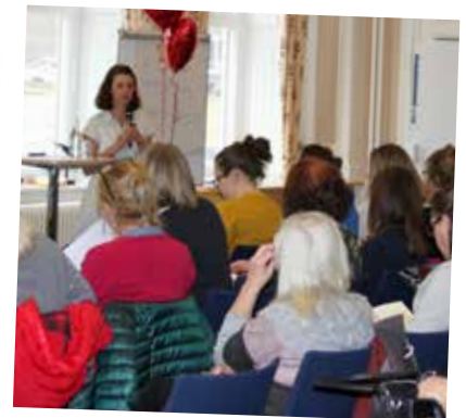
Ett åttiotal personer från Stockholmstad deltog i en utbildningsdag kring att upptäcka barn som lever i familjer med missbruk.

»Att genomgående känna andan som i sig ger en mod att börja våga reflektera. Många autentiska exempel där egen praktisk erfarenhet vävs ihop med klienternas upplevelser och teoretisk förankring. Det blir så mycket lättare att förstå.«