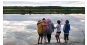
56 barn och ungdomar har deltagit i de tre sommarläger som Ersta Vändpunkten anordnade under 2019.

UNDER LÄGERVECKAN fördjupar vi oss ytterligare i teman som känslor, gränser och familjeroller. Syftet är att stärka barnens självkänsla, lära dem hur missbruket påverkar och att de kan sätta gränser och har rätt att må bra, även om deras föräldrar mår dåligt. Typiska sommaraktiviteter som bad, kanotpaddling, sagostunder, lekar och lägerbål är också en viktig del av lägret. Under veckan skapas betydelsefulla vänskapsband med andra som vet hur det är att leva nära någon i missbruk. Lägerveckorna är populära och efterfrågade. Det kan vara sommarens enda positiva upplevelse och ger barnen ett fint minne att berätta om när skolan börjar igen.