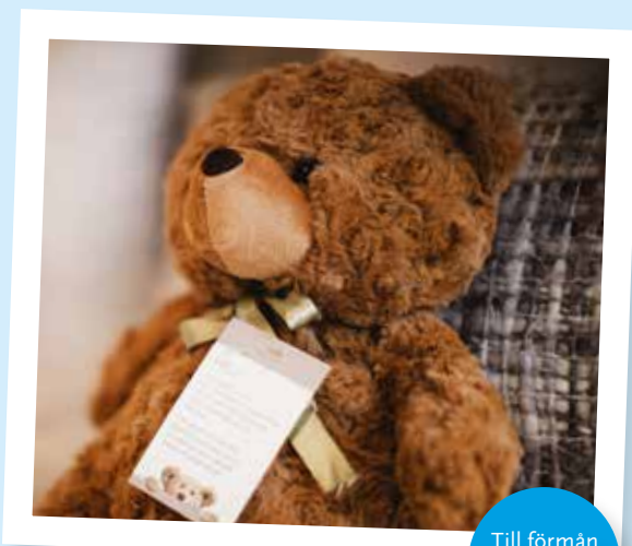
Till förmån för unga 9–23 år

FREYSNALLAR. Freys hotel har under många år stöttat Ersta diakonis verksamheter. Deras populära Freysnallar såldes under 2019 till förmån för Ersta Horisont, en professionell samtalsmottagning för unga mellan 9 och 23 år som lever i en vardag med en närstående som är allvarligt sjuk.