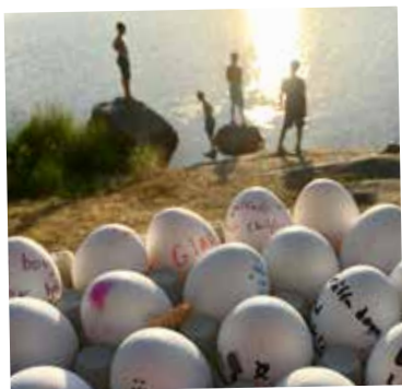
Barnen målar ägg med känslor och kastar dem på den stora stenen nere vid vattnet.